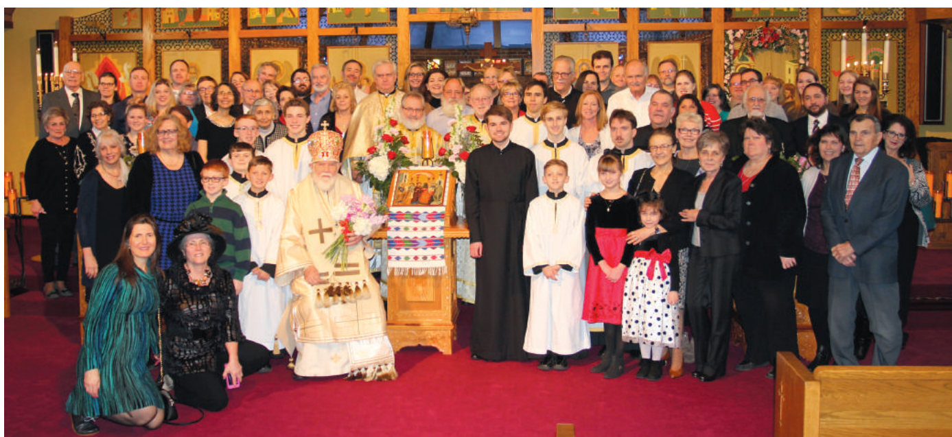
105th Anniversary of the Presentation of the Lord Parish, Fairlawn, OH - February 2 - 3, 2019.