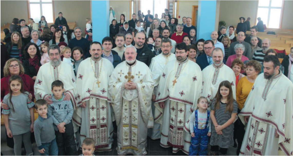
Primul Hram al Misiunii Sfântul Iosif cel Milostiv, Rive-sud, Montreal, Quebec, Canada - 26 ianuarie 2019.