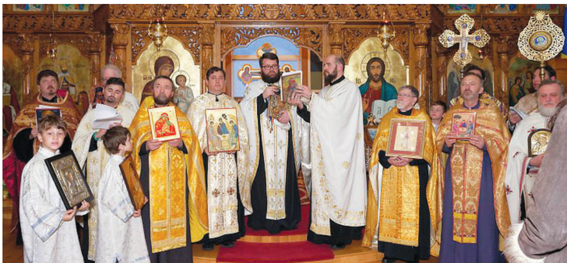
Vecernia din Duminica Ortodoxiei gazduită de parohia Sfânta Treime din New Westminster, Vancouver, Canada - 17 martie 2019.