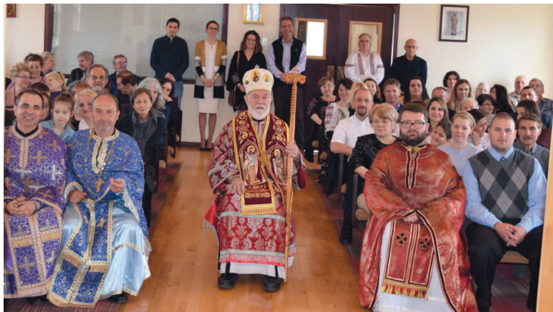
Aniversarea de 15 ani a parohiei Sfântul Ioan Hozevitul, Lakewood, CO - 24 martie 2019.