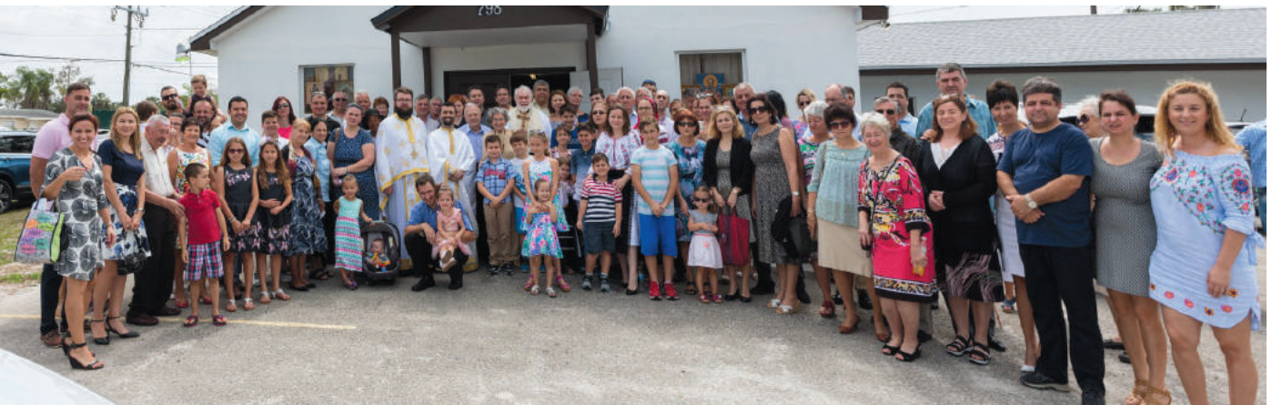
Hramul și Aniversarea de 10 ani a parohiei Sfântul Policarp al Smirnei, Naples, FL, 23 - 24 februarie 2019.